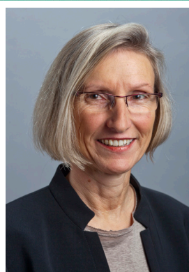
Prisca Birrer-Heimo Nationalrätin SP, Präsidentin Stiftung für Konsumentenschutz

Schweizer Unternehmen, Bauern, das Gesundheits- und Bildungswesen sowie die öffentliche Hand sind auf Vorleistungen aus dem Ausland angewiesen. Das Problem ist: Oft zahlen sie einen ungerechtfertigten Schweiz-Zuschlag. Denn beim Kauf vieler Produkte besteht ein Beschaffungszwang zu überhöhten Preisen. Die Zeche bezahlen Unternehmen, öffentliche Institutionen und wir alle – als Prämien-, Gebühren- und Steuerzahler.